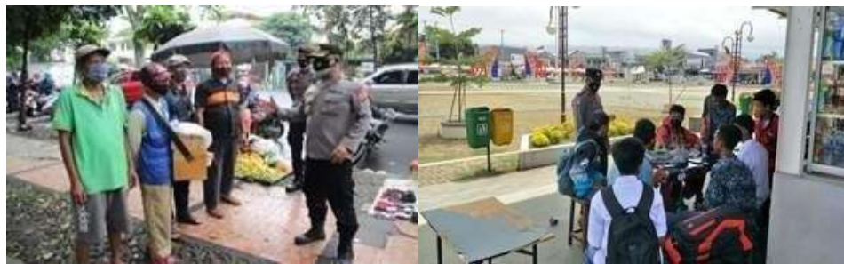
Gambar 1. Sosialisasi Public Address Secara Langsung

Effort merupakan elemen dasar sebagai tolak ukur efektivitas program. Indikator dalam elemen ini terdapat dua sub yaitu kualitas pelayanan dan data jumlah hasil pelayanan yang telah dilaksanakan. Dalam hal ini program Public Address telah berjalan selama dua tahun dan selalu rutin dilaksanakan setiap bulan, hal tersebut sejalan dengan yang diungkapkan oleh Kepala Sub Dit Bintibsos selaku atasan langsung yang menangani program. Hal yang sama diungkapkan oleh Bamin Bintibsos selaku petugas pelaksana program yang menyatakan bahwa program Public Address tidak pernah absen dilakukan dalam dua tahun dan telah menerima respon positif dari masyarakat dengan ramahnya mereka menyambut kedatangan tim pelaksana lalu banyaknya pertanyaan yang diajukan selama berlangsungnya program tersebut mengenai covid-19 . Pernyataan itu sejalan dengan fakta lapangan yang ditemukan selama masa observasi berlangsung peneliti ikut terjun dalam melaksanakan program selama dua bulan dan ditemukan bahwa para pelaksana program Public Address telah melakukan upaya yang terbaik guna menghasilkan kualitas yang optimal dalam program ini.