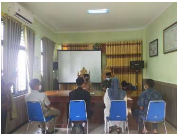
Gambar 2. Pelayanan Nikah di KUA Kecamatan Ciamis tahun 2022

pelaksanaan akad nikah dilokasi yang ditentukan pengantin. Namun apabila pernikahan dilaksanakan di KUA Kecamatan biaya nikah gratis, KUA akan langsung memeriksa data nikah dan langsung melaksanakan akad nikah diwaktu yang telah ditentukan (Kementrian Agama Republik Indonesia, 2018) .