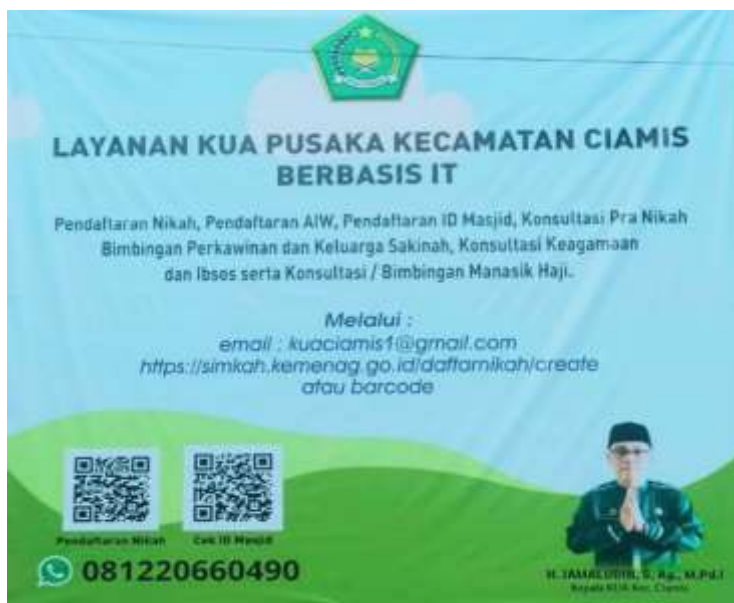
Gambar 3. Informasi Layanan KUA Kecamatan Ciamis Berbasis IT 2022

menggunakan website simkah.kemenag.go.id tanpa adanya penggunaan aplikasi. sehingga pelayanan akan lebih cepat dan mudah diberikan tutur Kepala KUA Kecamatan Ciamis.